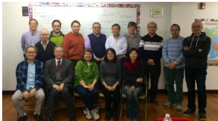
2月1號中文堂執事會整日完成第二步驟後合照